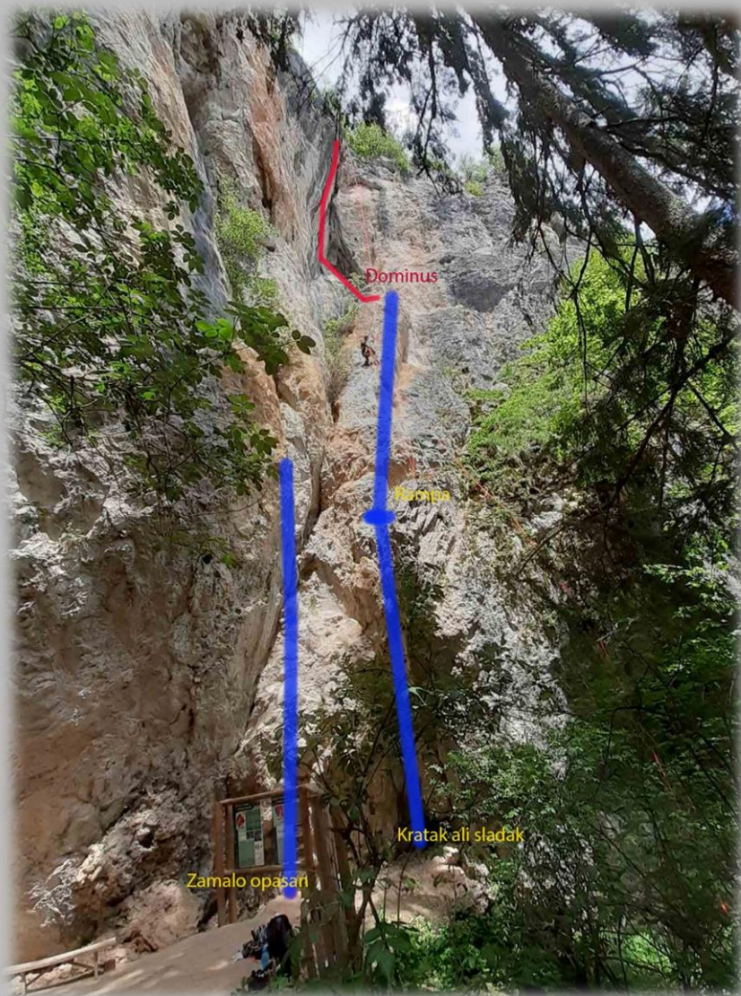
Sektor „Srednja pećina“

Lokacija, desni dio stijene pored platoa za ulaz u srednju pećinu.