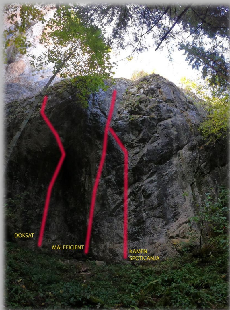
Sektor „Srednja pećina“